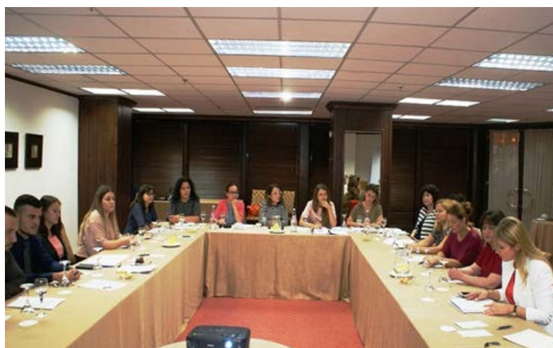
Gjatë zhvillimit të projektit për zhvillimin e kapaciteteve mbikëqyrëse dhe rregullimit në tregun e kapitaleve

Autoriteti i Mbikëqyrjes Financiare në datat 19-20 shtator organizoi një workshop në nisje të trajnimeve të fazës së tretë të projektit "Forcimi i kapaciteteve mbikëqyrëse të Autoritetit të Mbikëqyrjes Financiare: Fokusi tek zhvillimi i tregut të kapitaleve". Kjo fazë e tretë e projektit ka si objektivi kryesor kualifikimin profesional të specialistëve dhe ekspertëve në mbikëqyrjen dhe rregullimin e tregut të kapitaleve.