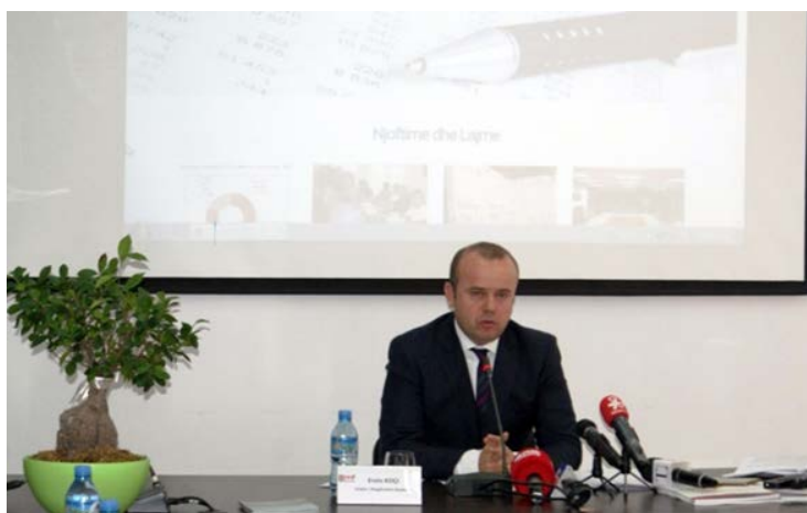
Drejtori i Përgjithshëm Ekzekutiv i AMF-së, Z. Ervin Koçi gjatë konferencës me mediat

Z. Koçi u ndal te problemi i mbartur ndër vite me Fondin e Kompensimit, duke theksuar se AMF po punon për t'i dhënë një zgjidhje përfundimtare brenda vitit 2018.