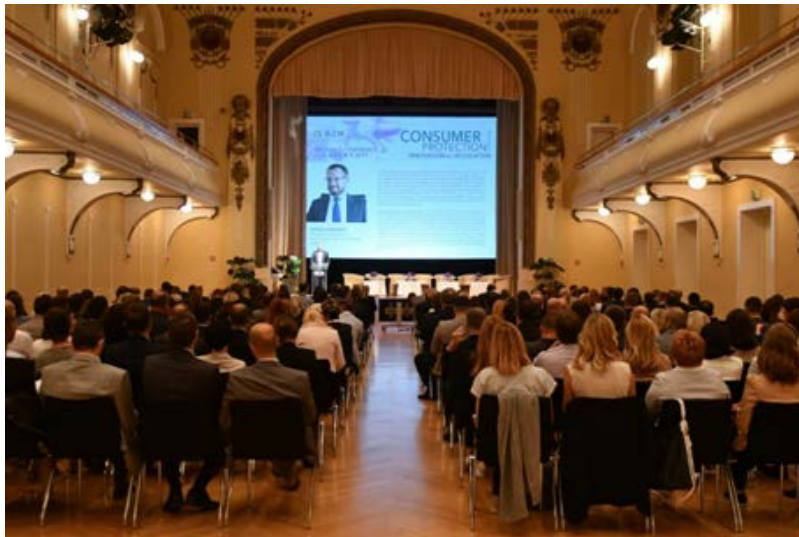
Gjatë zhvillimit të konferencës

i tërë dhe i shikojnë ndryshimet e ardhshme rregullatore si një mjet jetik për të rritur mbrojtjen e konsumatorit dhe për të përmirësuar praktikat e biznesit. Përveç kësaj, risitë teknologjike në fushën e shitjeve të sigurimeve dhe proceseve të tjera të sigurimeve do të kenë gjithashtu një ndikim të thellë tek siguruesit, proceset e tyre dhe në modelet e tyre të biznesit.